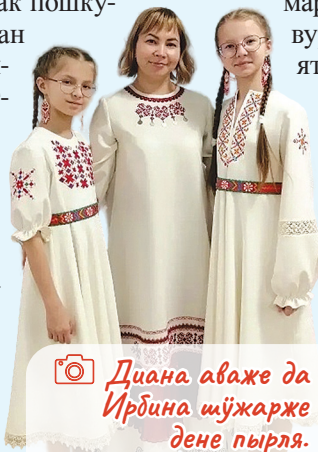
Диана аваже да Ирдина шўжарже дене пырля.

Марий ден чуваш-влак пошкудо улына, икте-весеылан энгертен илена. Йылмына тўрлў семын йонга гынат, икгай шомак ятыр уло. «Чуваш» мут XVI курымышто веле шочын. Тудо «заваз» татар шомак гыч лийын. Руш йылмыш кусараш гын, «заречные» але «прибывшие с другого берега» манме лиеш. Марий йылмыште «ў» буква уло, а чуваш йылмыште – «ў» (кок тоян «у»). Нуно иксемын йонгат.