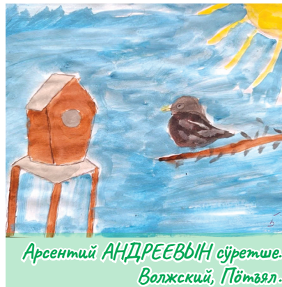
Арсентий АНДРЕЕВЫЙ сўретше. Волжский, Пўтъял.