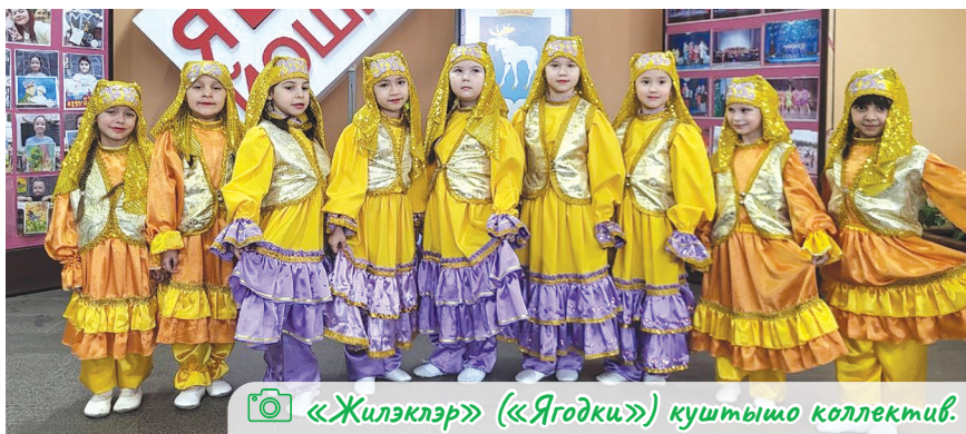
«Жилэклэр» («Ягодки») куштышо коллектив.

Марий Элыште 37 түжем утла татар ила. Калык йўлам, йылмым аралымаште Татар тұвыра рўдер кугу пашам шукта. Тудо Йошкар-Олаште 1997 ийыште почылтын. Төнежын илышыж нерген вуйлатышыже И.З.Гайсин дене мутым вашталтышна.