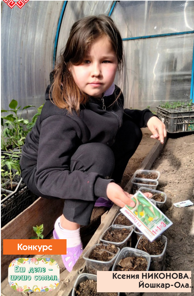
Конкурс Ёш денае - шошо сомыл.