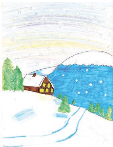
Милана БОГДАНОВАН сүретше.