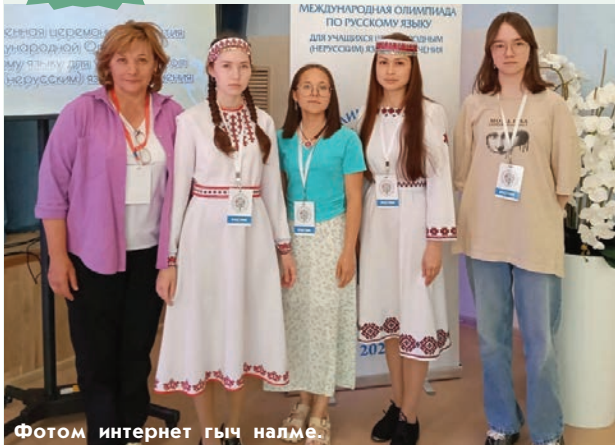
Фотом интернет гыч налме.

Руш йылме дене түнямбал олимпиадын заочный йыжынже эртаралтын. Тушко руш йылмым шочмо йылме семен огул тунемше-влак ушненыт. Олимпиадыште 8-10-шо класслаште шинчымашым погышо ўдыр-рвезе-шамыч танасеныт.