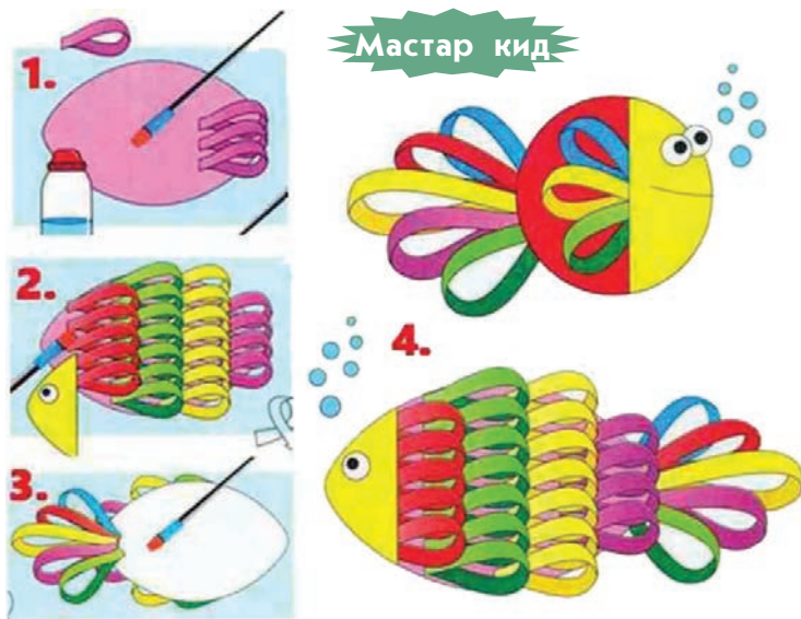
Кагаз гыч колым ыштыза.