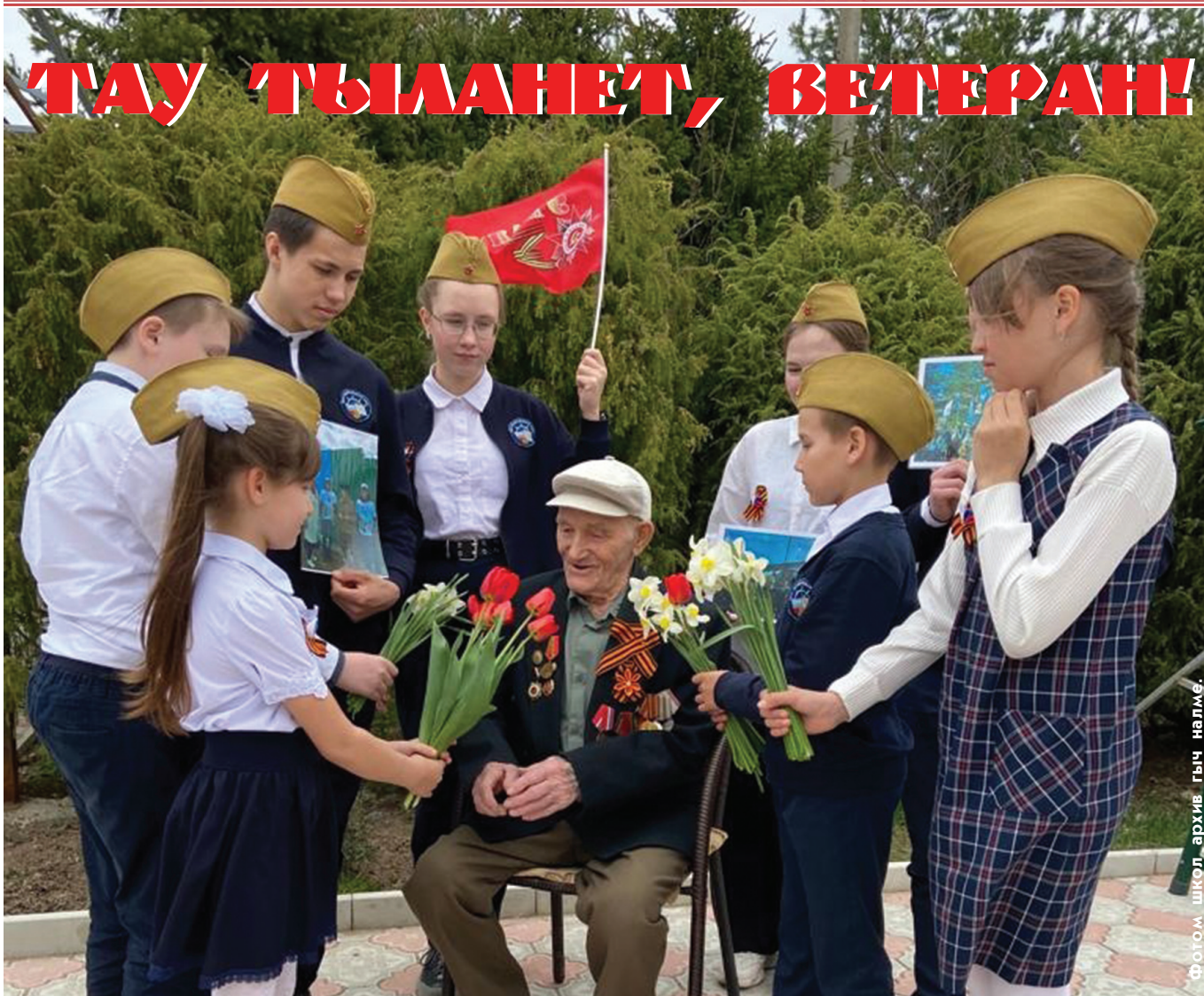
Фотом школ архив гыч налме.