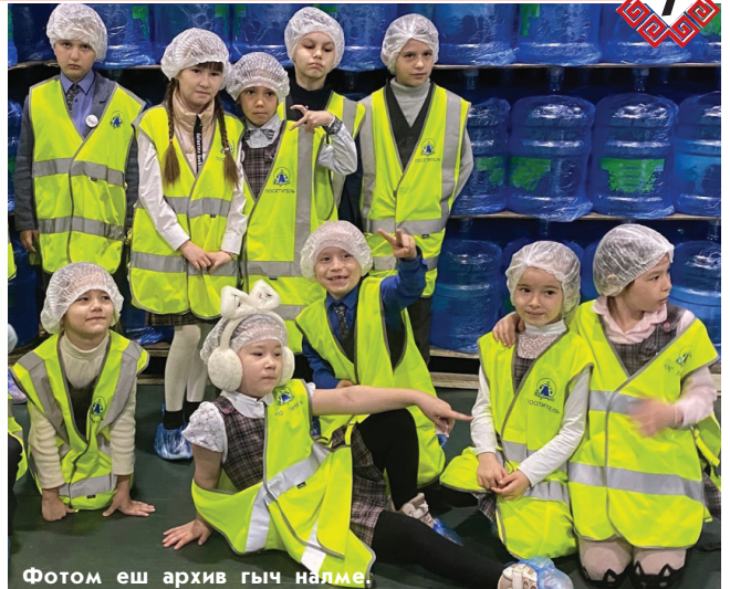
Фотом еш архив гыч нълме.