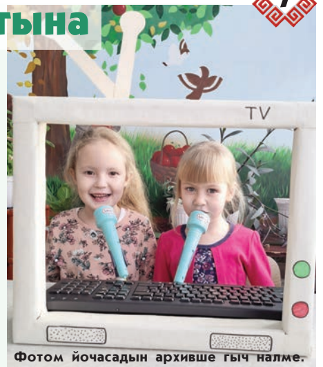
Фотом йочасадын архивше гыч налме.