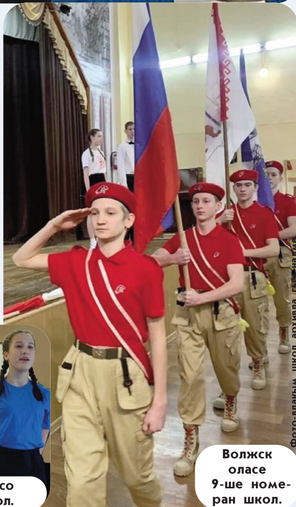
фото-влакыш школ архивла гыч