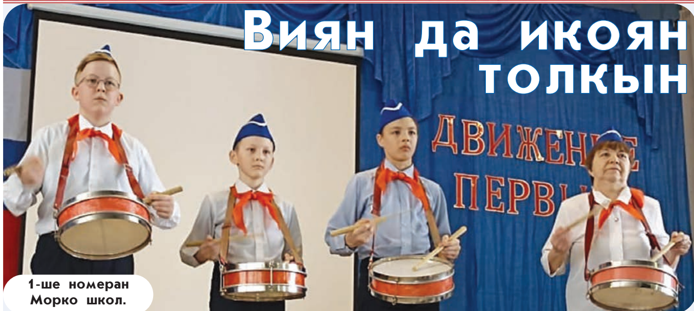
1-ше номеран Морко школ.

Йоча да самырык-влакын «Движение Первых» российскийсе мер-кугыжаныш толкынышт тўжем дене ўдыр-рвезым шке радамышкыже уша. Марий Эл Республикысе районлаштат да олалаштат первичный отделений-влакым почыт (снимкылаште).