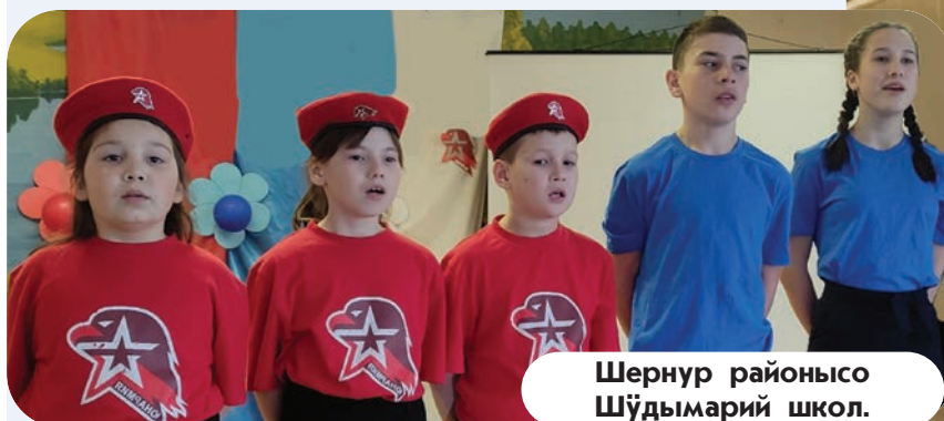
Шернур районысо Шўдымарий школ.