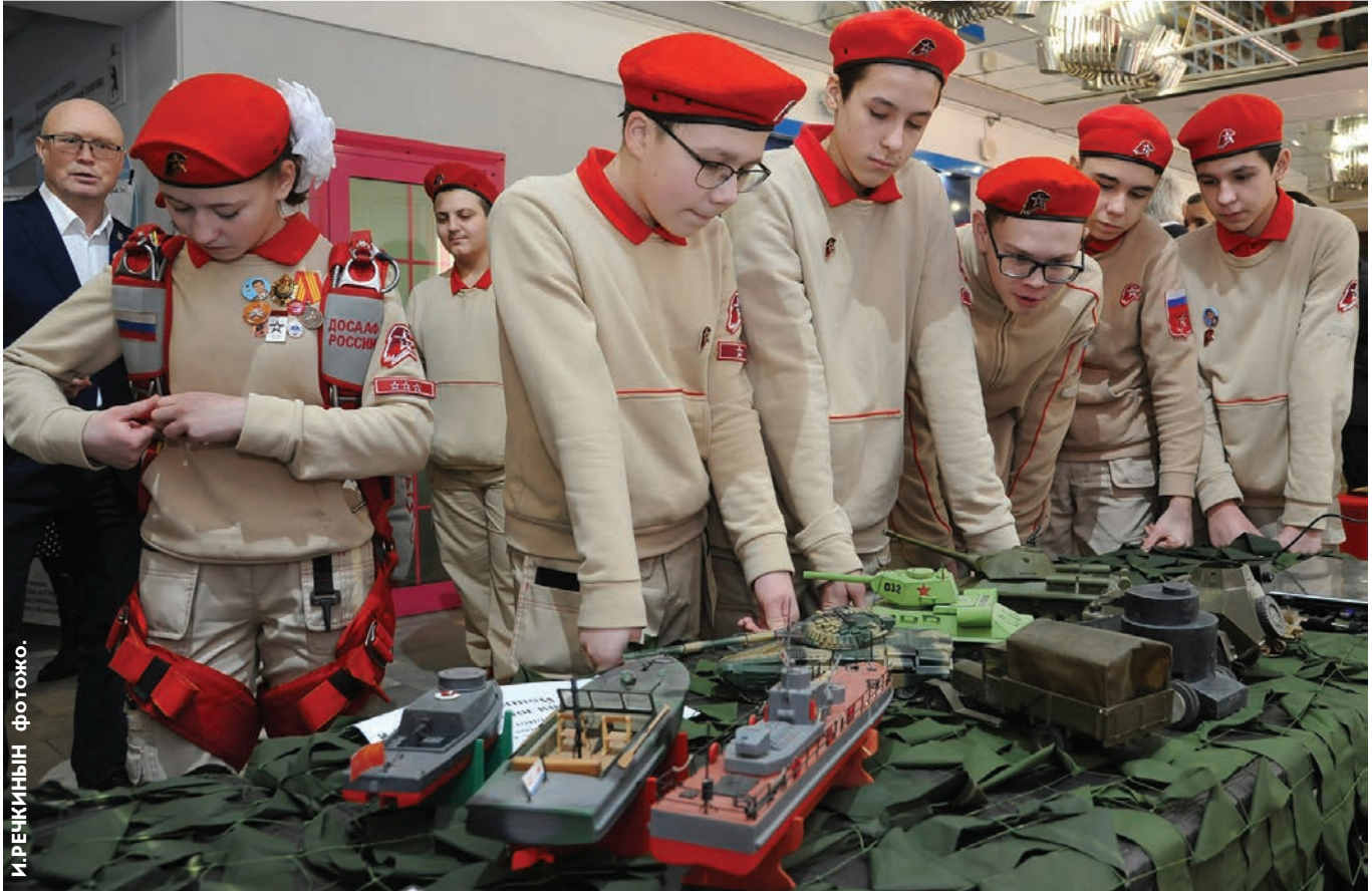
И. РЕЧКИНЫН фотожо.