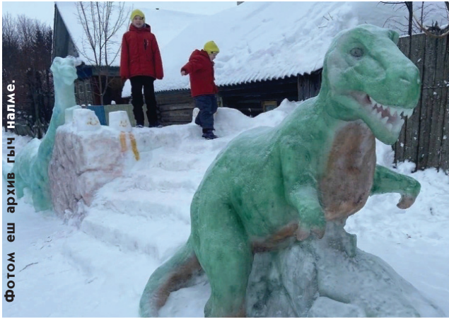
Фотом еш архив гыч палме.