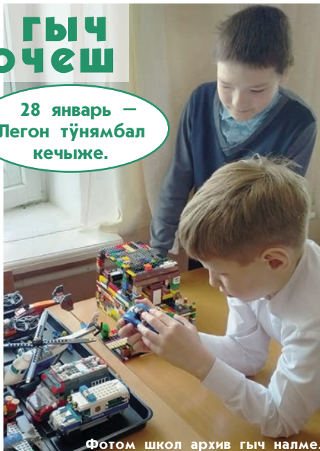
Фотом школ архив гыч налме.

тым, суртышто кучылтмо ўзгарым, кушкылым да молымат погат. Ончыкылык-лан шонымашышт ятыр. Йоча-шамыч XXII курым машинажым да олажым чонынешт.