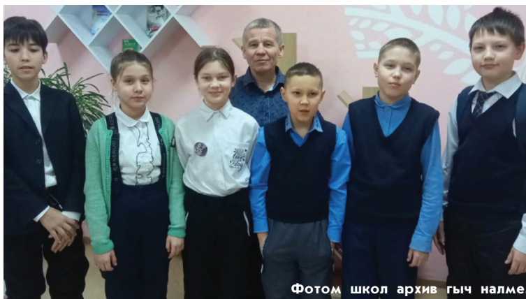
Фотом школ архив гыч налме.