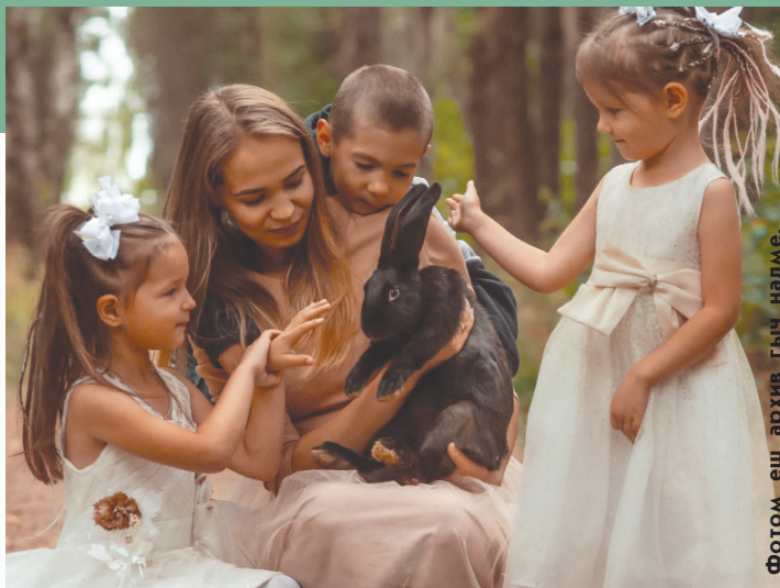
Фотом еш архив гыч налме.

Мотор, пушкыдо пунан йолташыштым йоча-влак пукшат, модыт, койышыштым эскерат. Икте шудым конда, весе ковышта дене сийла. Кажныжлан лўмым пуаш шонат. Ныл йолан йолташым ончен, поро кумылан, шке пашалан мутым кучышо кушкыт. Адакшым кроликын шылже