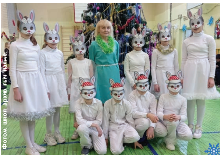
Фотом школ архив гыч налме.