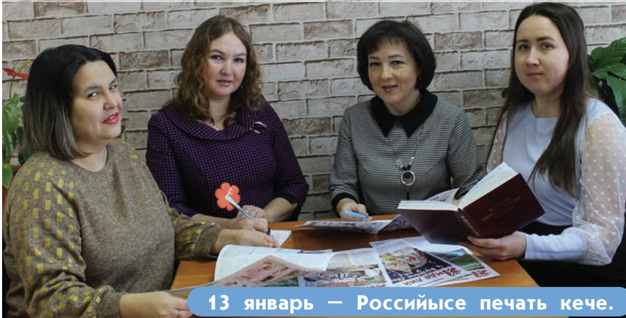
13 январь — Российысе печать кече.

Российысе журналист-влак 13 январьыште профессиональный пайремнам палемдена. 1703 ийыште Петр I кугыжан кўштымыж почеш «Ведомости» икымше газетым лачты кечын савыктен луктын.