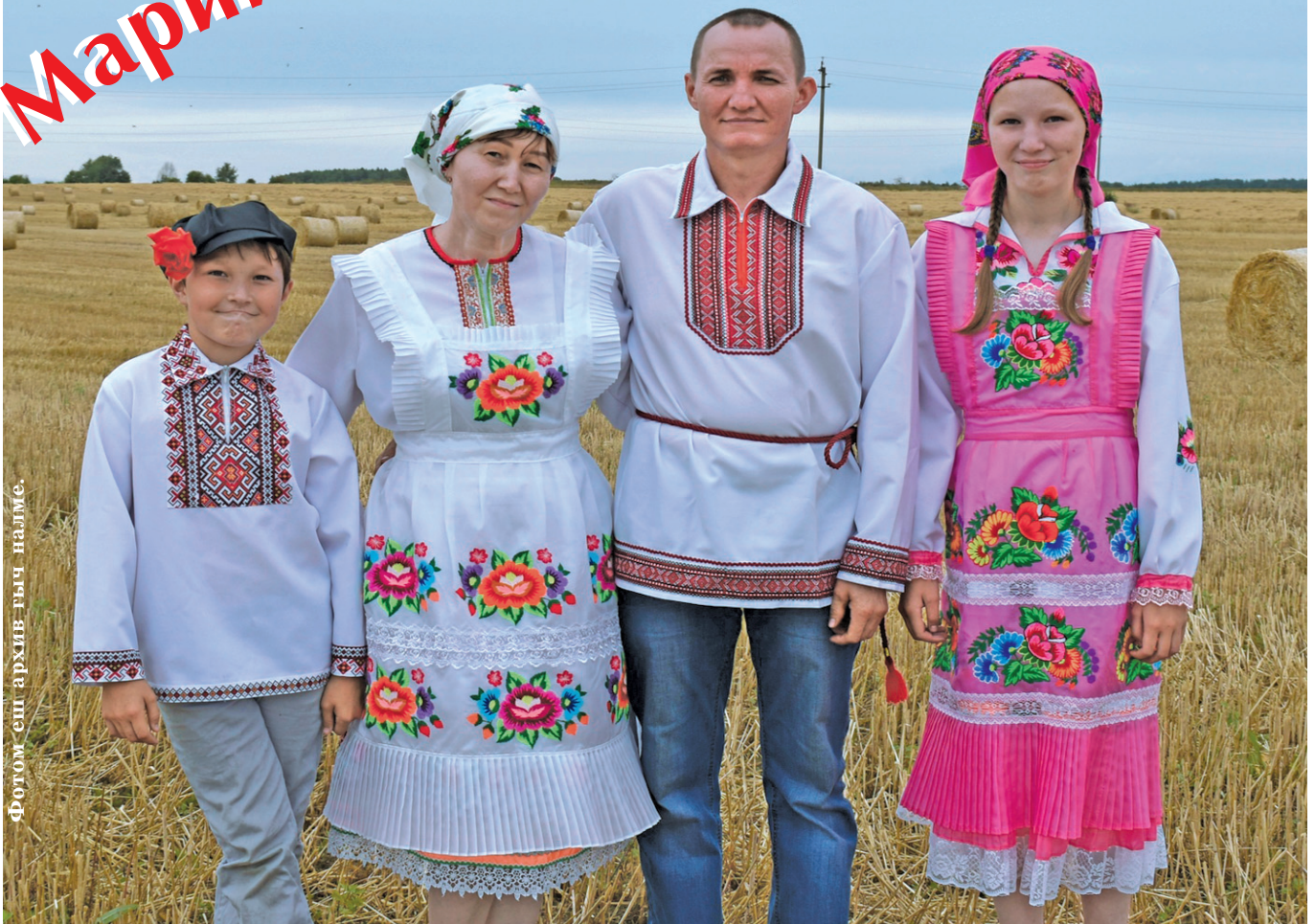
Фотом еш архив-гыч налме.