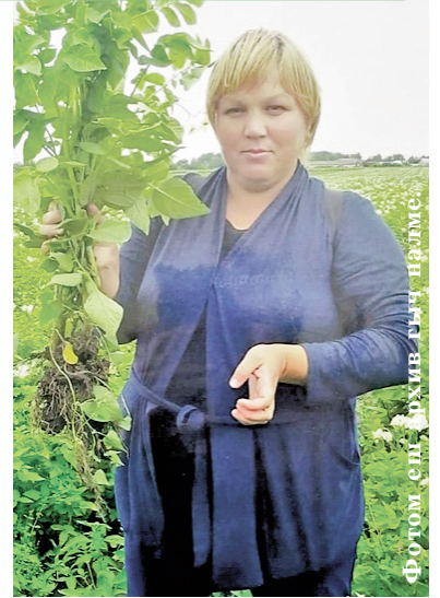
Фотом сийлэше гыч неле.