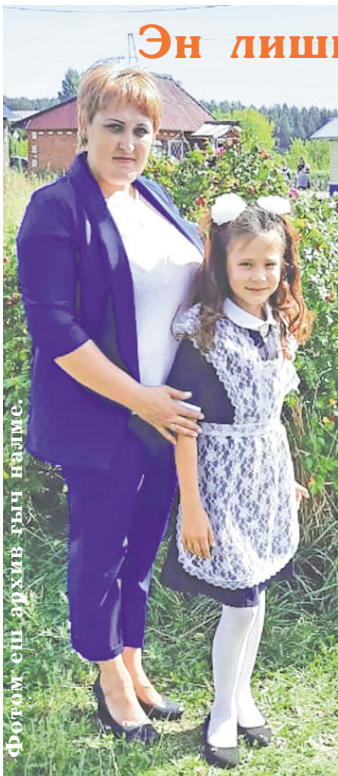
Фотом сийлэше гыч неле.