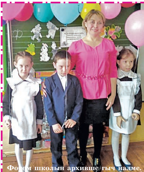
Фотом школын архивше гыч налме.