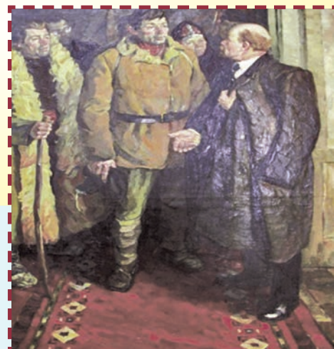
А.И.Бутовын «Декрет марийцам» (1967) сӱретше.

1920 ий 4 ноябрьште В.И.Ленин ден М.И.Калинин Марий автоном областым ыштыме нерген Декретеш кидпалыштым пыштеныт. 25 ноябрьште МАО-н кумдыкшым, рӱдолажым, вуйлатыше органжым палемдыме нерген у декретым пенгыдемденет. Рӱдолаже Краснококшайск лийын. МАО-ш