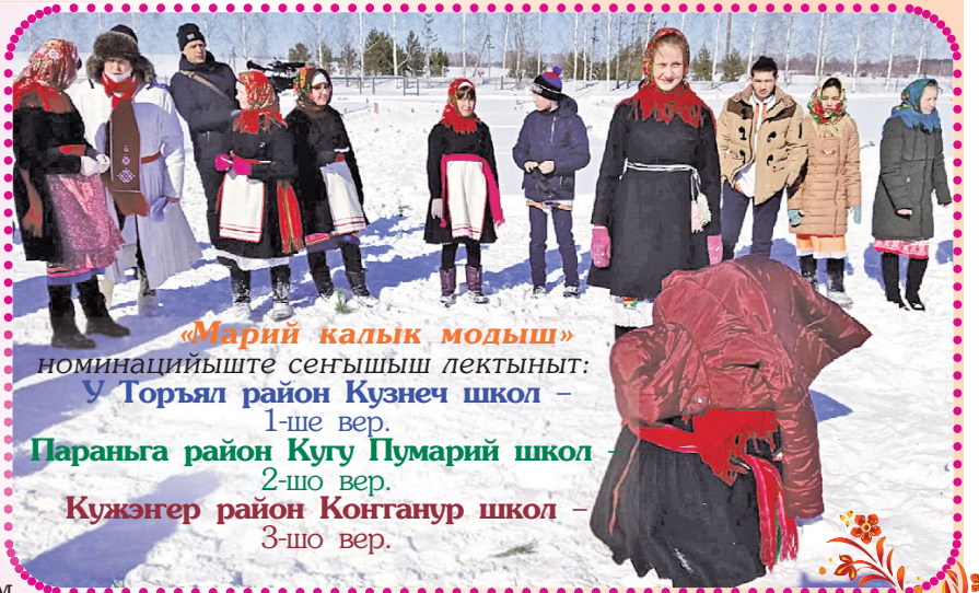
«Марий калык модыш» номинацийыште сенгышыш лектыныт: У Торъял район Кузнеч школ – 1-ше вер. Параньга район Кугу Пумарий школ – 2-шо вер. Кужэнер район Конганур школ – 3-шо вер.

Кужэнер район Конганур школын тунемшыже-влак «Маска – чодыра оза» модыш дене модыктеныт (снимкыште). Йоча-влак онгышко шогалыт. Вўдышў шотлымо мут почеш маскам ойыра. Маска онго покшелан шинчеш. Модшо-влак тудын деке саскам поген мият да тыге ойлат: «Маска – чодыра оза. Маска – чодыра ача. Тыйын модетым погена, тыйын пўчыжетым ойырена. Сай саскажым налына, начар-ракшым кодена». Ойлен пытарымеке, Маска пуйто вынем гыч лектеш да саскам погаш толшо-влак кокла гыч иктаж-кўм руалтен кучаш тырша. Кўм куча, тудо маска лиш. Кучен ок керт гын, модшо-влакын йодмыштым шукта.