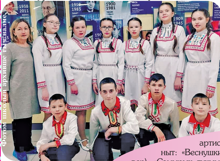
Фотом школын архивше гыч налме