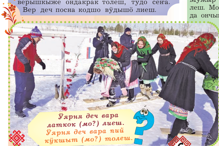
Ўярня деч вара латкок (мо?) лиш. Ўярня деч вара пий кўжыт (мо?) толеш.