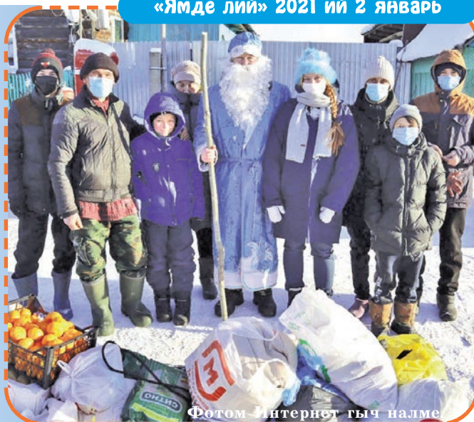
Фотом Интернет гыч налме