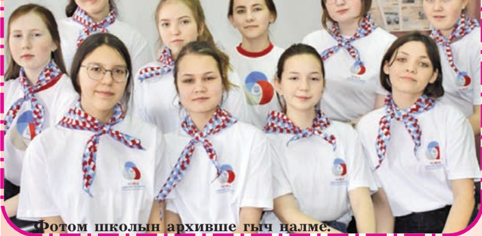
Фотом школын архивше гыч налме.

Морко район Коркатово лицейште кум волонтер отряд уло. Нунын кокла гыч иктыже – «Лицейсты добра» (снимкыште). Тудым кок ий ончыч