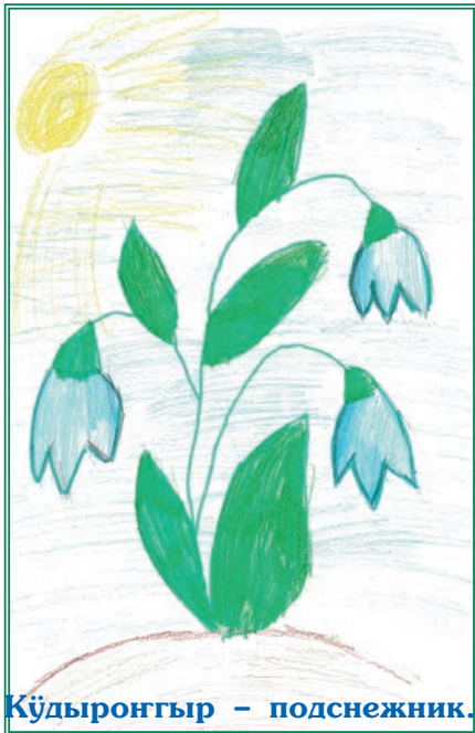
Күдыронгыр – подснежник.