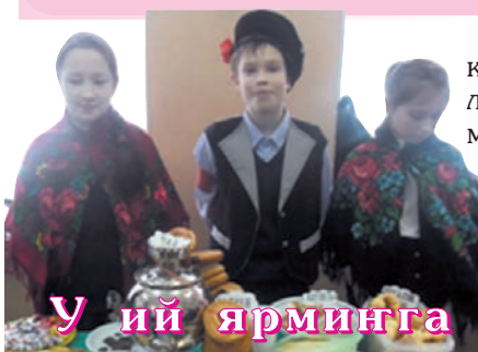
У ий ярминга

Волонтер ден ача-ава-влакын полшымышт дене школыштына ярмингам эртарынамаш поро йўлашке савырнен. Ты ганат пеш онгайын эртаралтын. Тунемше-влак ыштен кондымо кочкышыштым, тўрлõ арверыштым ўчашен-ўчашен ужаленыт. 4-ше ден 5-ше класс-влак чолгалыкышт дене ойырте-малтыныт. Ыштен налме оксам У ий пайремым эртараш кучылтмо.