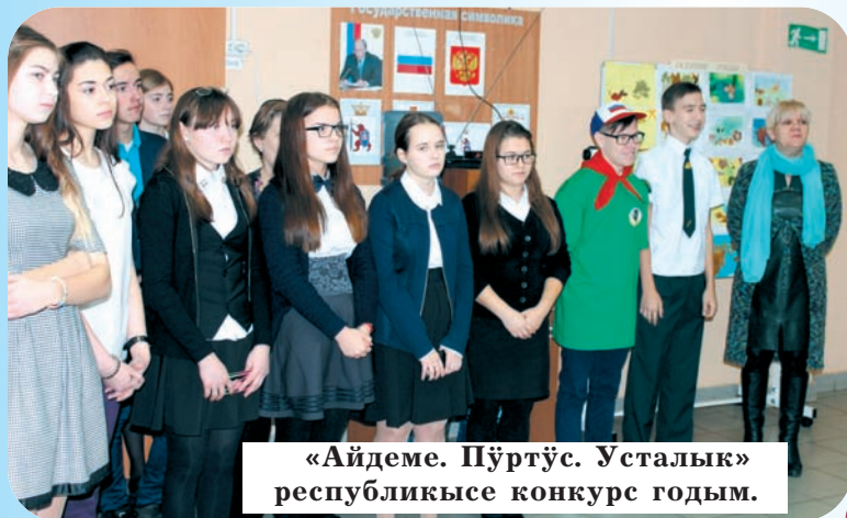
«Айдеме. Пүртүс. Усталык» республикысе конкурс годым.

кабинетым почаш шонена. Вара тиде кабинет чодыра дене кылдалтше просветительский рүдерыш савырнышаш. Йоча рүдерна экологий дене шинчымашым шарыме шотышто федеральный инновационный площадкылан шотлалтеш. Тыгайже республикыште икте веле.