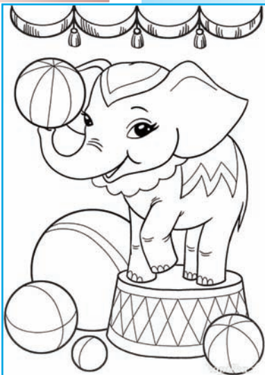
Ойыртемем му да сүретым чиялте.