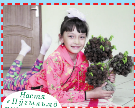
Настя «Пүгылъмö пушенгым» ыштен.