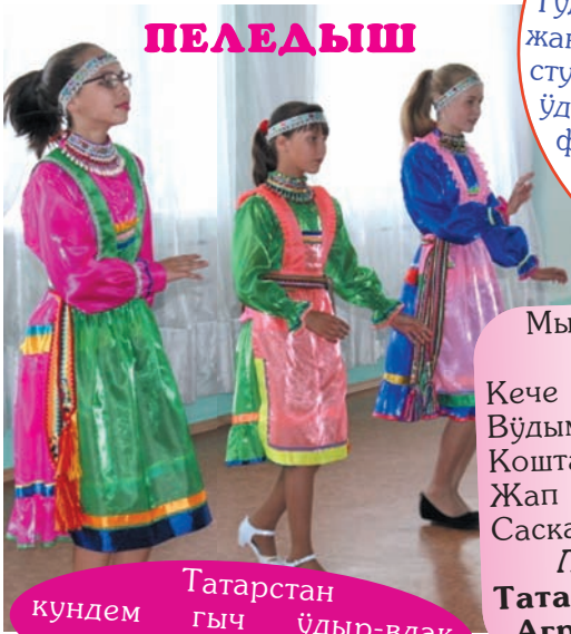
Татарстан кундем гыч үдыр-влак пеледыш гаяк улыт.

Мыйын уло пакчаштем Кече гай пеледышем. Вўдым кечын шавалтен Коштам мые муралтен. Жап шумеке йывыртом, Саскам мые погалтем.